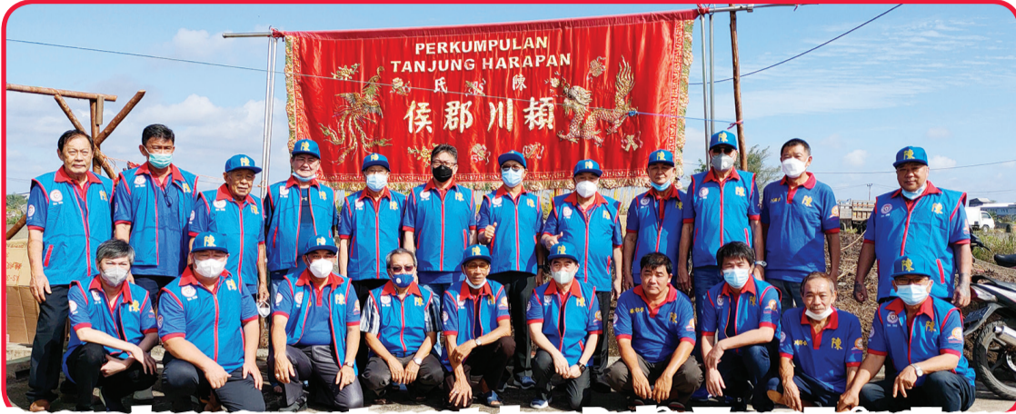
Pengurus dan pengawas serta anggota dewan Pembina Yayasan Tanjung Harapan berfoto bersama.