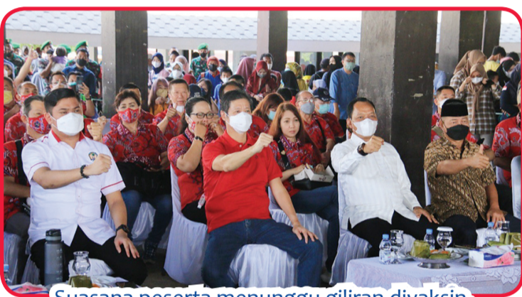
Suasana peserta menunggu giliran divaksin.