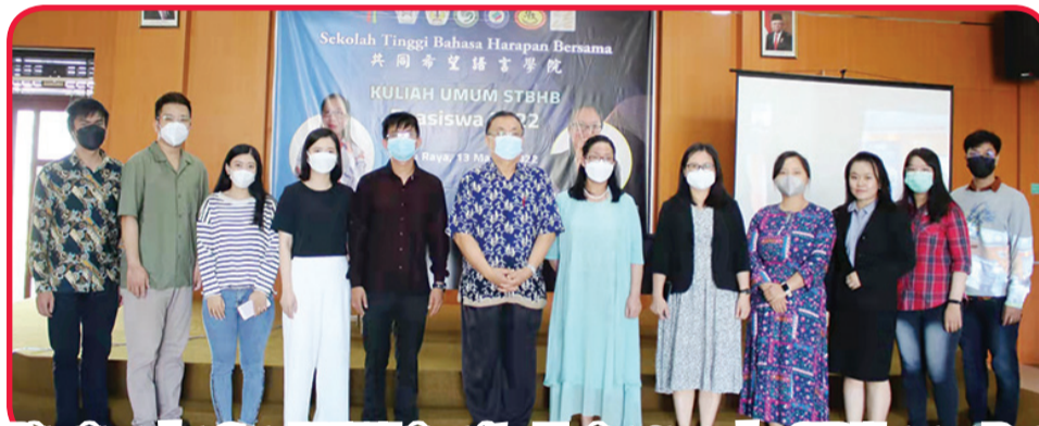
Pimpinan dan Guru PBM Universitas Tanjungpura dan STB Harapan Bersama Pontianak berfoto bersama.

Dia juga mengatakan bahwa banyak guru di perguruan tinggi tersebut telah memperoleh berbagai jenis beasiswa studi di Tiongkok.