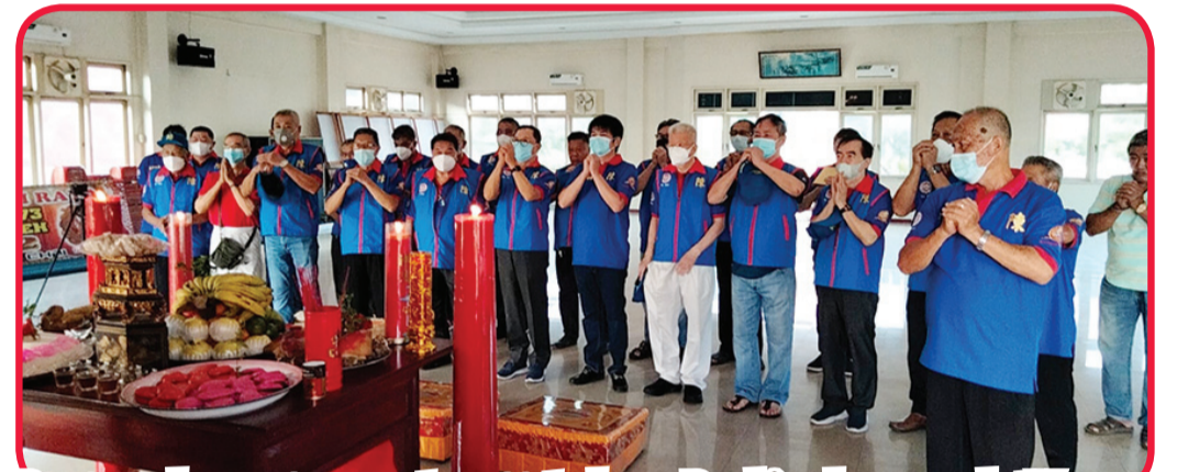
Pengurus dan pengawas serta anggota dewan Pembina dan penasehat Yayasan Tanjung Harapan melakukan ritual bakar hio.