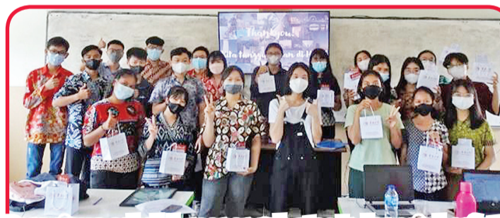
Para siswa sekolah menengah atas Indonesia berfoto bersama "Tim Magang Nusantara".

Pada saat yang sama, mereka memanfaatkan media sosial seperti WhatsApp Group dan Feed Instagram. Perangkat lunak ini akan mempublikasikan acara sekaligus menyampaikan pemberitahuan terkait acara.