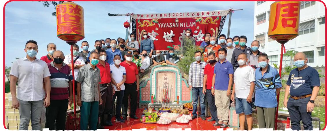
Pengurus dan pengawas Yayasan Nilam melakukan sembahyang leluhur di pemakaman keluarga Marga Zhou.

PONTIANAK (IM) - Minggu (20/3) lalu bertepatan dengan tanggal 18 bulan dua Imlek atau hari pertama kegiatan sembahyang leluhur komunitas Tionghoa Pontianak dan warga Tionghoa di Kalimantan Barat khususnya Pontianak.