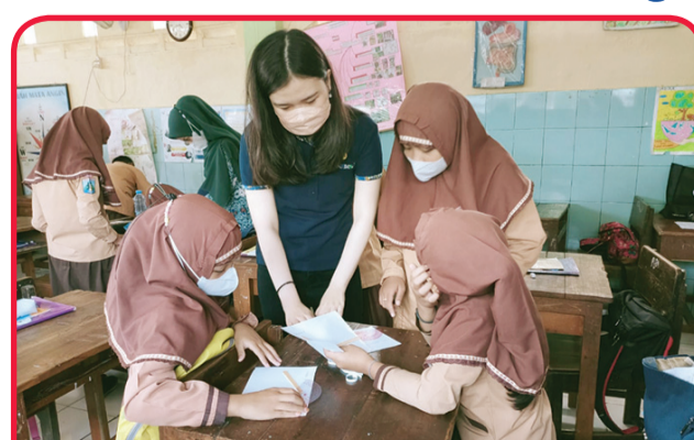
Para mahasiswa mengajar matematika dengan telaten.

Para mahasiswa terbagi dalam 32 kelompok yang mengajarkan berbagai materi matematika berbeda. Seperti pelajaran, perkalian, pembagian, pecahan campuran,