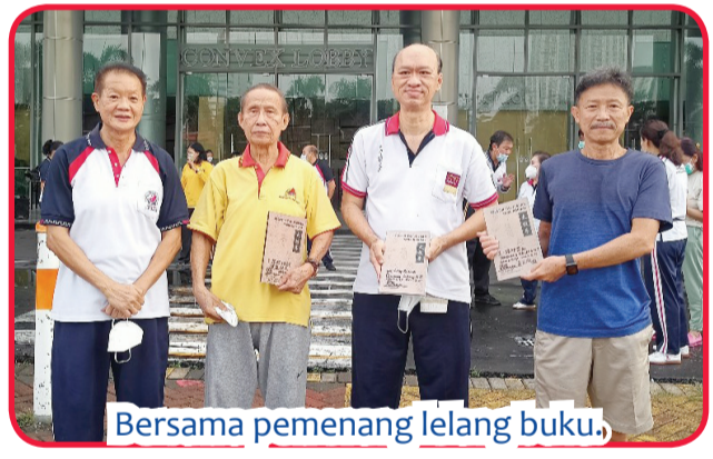
Bersama pemenang lelang buku.