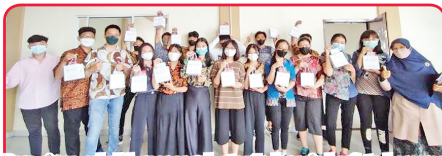
Para siswa sekolah menengah atas Indonesia berfoto bersama "Tim Magang Nusantara".

Sejak 21 Januari hingga 14 Maret lalu, "Tim Magang Nusantara" ini berkunjung ke 8 sekolah menengah atas untuk kegiatan promosi. Tim ini telah menggelar 8 kegiatan promosi baik online dan 2 offline, diikuti lebih dari 540 siswa, orang tua dan guru.