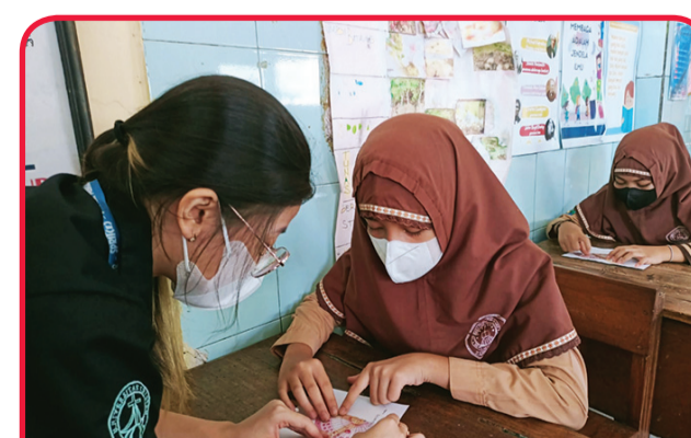
Siswi kelas 4 belajar sudut.

Mengangkat tema "SPRIT(E): Slight Step Everlasting Impact", kegiatan ini