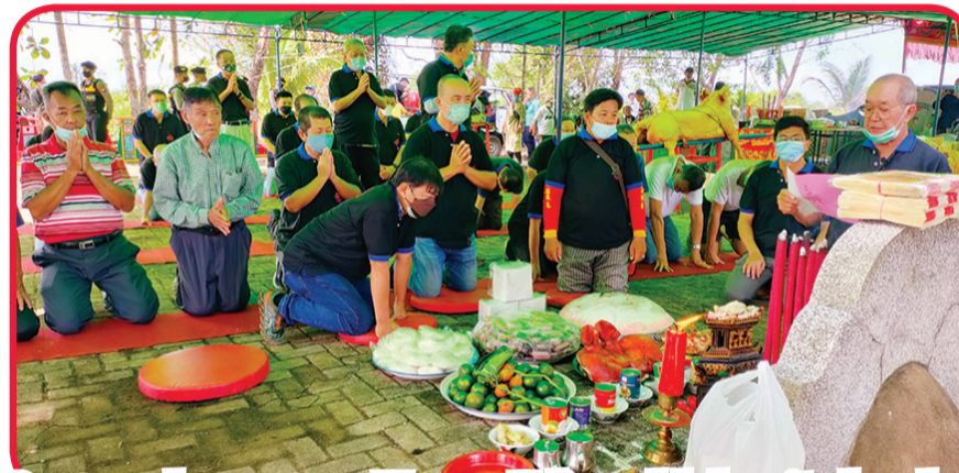
Pengurus dan pengawas Yayasan Halim melakukan ritual sembahyang leluhur di pemakaman keluarga Marga Lim.

kumpulan Marga Lu, Bogonghui, Renyishe dan Yayasan Asali Pontianak. • idn/din