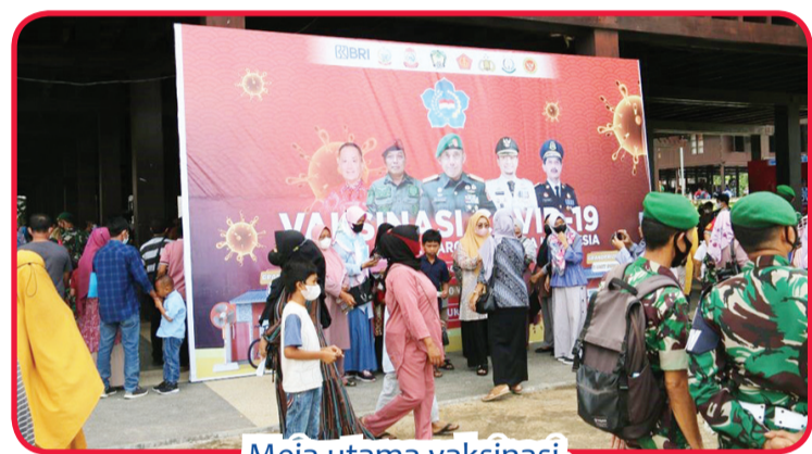
Meja utama vaksinasi.